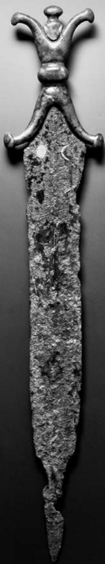
Keltisches Kurzschwert, Landesmuseum Mainz, Foto: Ursula Rudischer